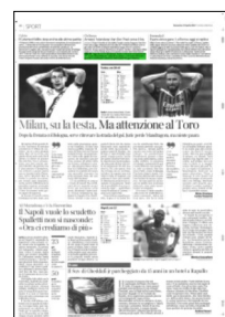
Superficie 1 %

ARTICOLO NON CEDIBILE AD ALTRI AD USO ESCLUSIVO DEL CLIENTE CHE LO RICEVE - 4