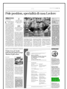
Superficie 1 %

ARTICOLO NON CEDIBILE AD ALTRI AD USO ESCLUSIVO DEL CLIENTE CHE LO RICEVE - 4