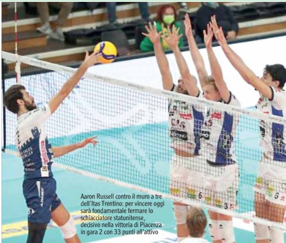
Aaron Russell contro il muro a tre dell'Itas Trentino: per vincere oggi sarà fondamentale fermare lo schiacciatore statunitense, decisivo nella vittoria di Piacenza in gara 2 con 33 punti all'attivo